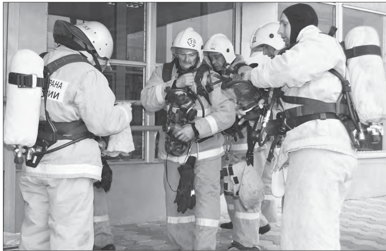
■ Учения у спасателей проходят регулярно