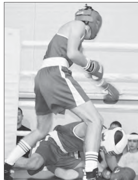
Знаменитый нокаут Максима Белоконова